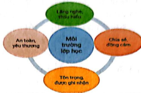
Hình 3. Mô hình các tiêu chí lớp học hạnh phúc

phù hợp với học sinh của mình nhất, và học sinh có thể đóng góp ý kiến về nội quy này. Các quy tắc, nội dung lớp học đều xây dựng dựa trên mô hình sau: