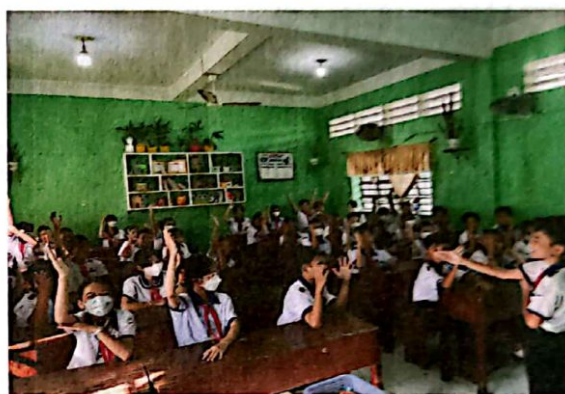
Hình 7. HS tham gia trò đổ đũa

Và để đánh giá việc thực hiện sinh hoạt 15 phút đầu giờ, cuối tuần tôi yêu cầu tổ trưởng các nhóm nhận xét về từng buổi sinh hoạt trong tuần, nhóm được tuyên dương sẽ phát huy, nhóm làm chưa tốt sẽ rút kinh nghiệm để lần sau thực hiện tốt hơn. Bên cạnh đó, để đánh giá khách quan nhất, tôi sẽ căn cứ vào số trực của tổ cờ đỏ hàng ngày.