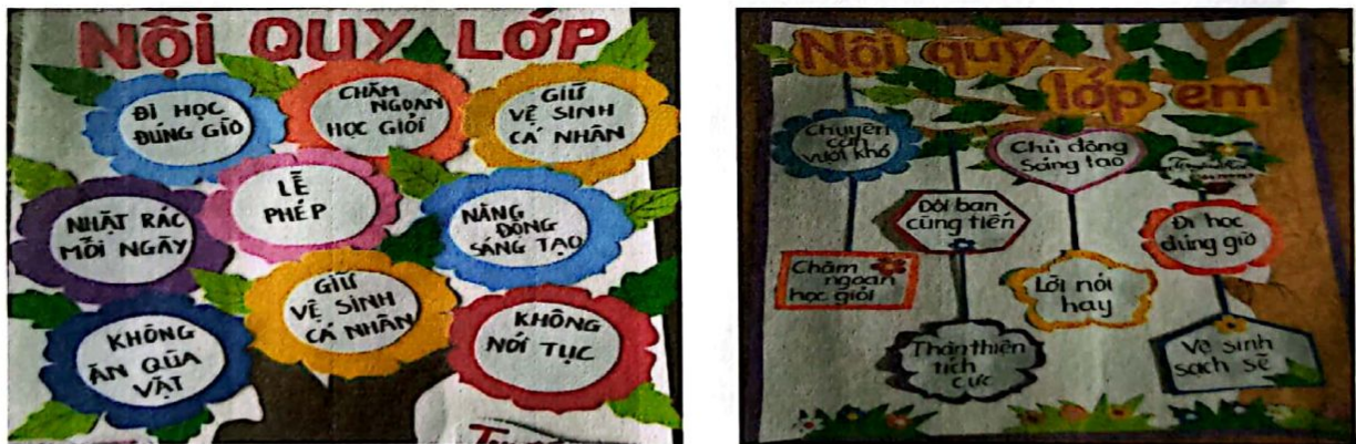
Hình 4. Nội quy lớp học được học sinh trang trí trên lớp

Sau khi đã xây dựng được nội quy lớp học, thay vì yêu cầu học sinh chép nội quy lớp học vào tập sẽ tạo cảm giác áp đặt, khiến cho một số em mang hơi hướng chống đối. Thay vào đó, tôi yêu cầu 4 tổ tự vẽ, thiết kế và trang trí nội quy lớp học lên giấy A0 sau đó sẽ dán lên vị trí các tổ, việc làm này vừa giúp các em ghi nhớ được nội quy, vừa giúp các em phát huy tính sáng tạo và tinh thần đoàn kết. Việc mỗi ngày nhìn thấy nội quy lớp học sẽ giúp các em ghi nhớ lâu và thực hiện nghiêm túc hơn.